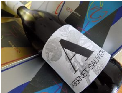
Cabernet Sauvignon 2017 Dop